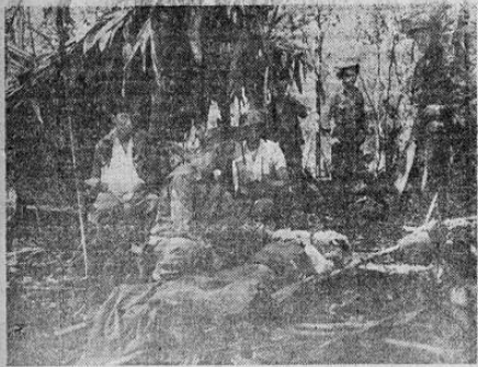
Soldados norteamericanos heridos en combate contra los japoneses en la isla de Nueva Guinea reciben atención médica de emergencia para ser llevados después hasta un hospital de campaña.

CORRESPONDEN ESOS VOTOS A LAS PROVINCIAS DE ALAJUELA Y DE HEREDIA. — 12.216 VOTOS CORRESPONDEN AL PICADISMO Y 20.739 AL CORTESISMO. El Consejo Nacional Electoral realizó ayer los escrutinios correspondientes a la provincia de Heredia, pero como los de Alajuela todavía no se han completado no han sido sumados los votos cómputos.