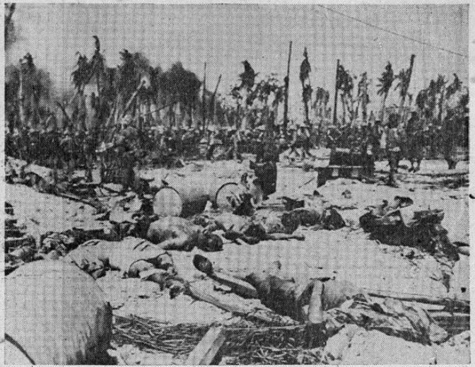
Después de un poderoso ataque naval, aéreo y terrestre de las fuerzas de los Estados Unidos contra las islas Marshall, la playa del atol de Kwajalein quedó cubierta de cadáveres de los defensores japoneses, cuyas bajas se calculan en más de ocho mil. El atol fué ocupado por las fuerzas estadounidenses y precedió al desembarco de un mortífero bombardeo naval y aéreo.