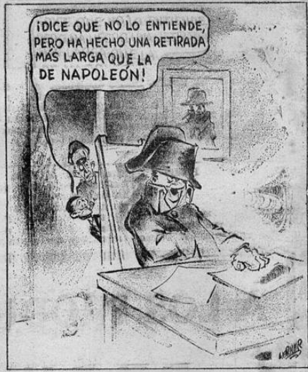
Werner en el Chicago Sun.

davía más baja que las pérdidas alemanas de ciento ochenta y cinco aparatos en un día de la batalla de la Gran Bretaña. Aviones Marauders americanos de la novena fuerza aérea trasladados recientemente a la Gran Bretaña del área del Mediterráneo, atacaron hoy objetivos en Holanda, bajo el resguardo de cazas aliados y otras fuertes formaciones de bombarderos y cazas fue vista volando a través del canal de la Mancha hacia Francia durante el día.