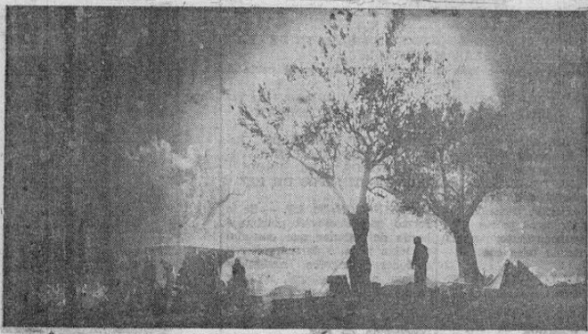
El resplandor producido por el disparo de un potente cañón calibre 155 del ejército norteamericano dibuja las siluetas de los soldados y árboles en una posición en el frente italiano. La precisión de estos cañones de alto calibre ha sido de gran utilidad para destruir las defensas nazis.

do los puntos más fuertes de las japonesas e nese archipiélago y en el de las Carolinas. El parte oficial informa que las bajas en